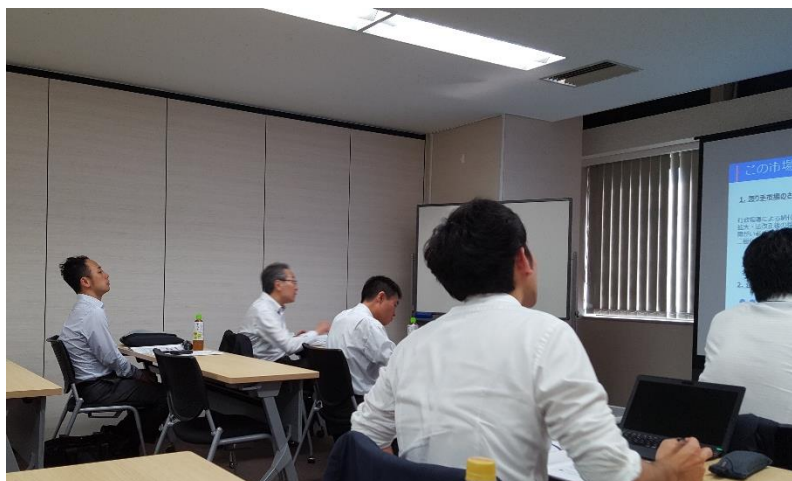
セミナー参加者の満足度（5点満点）